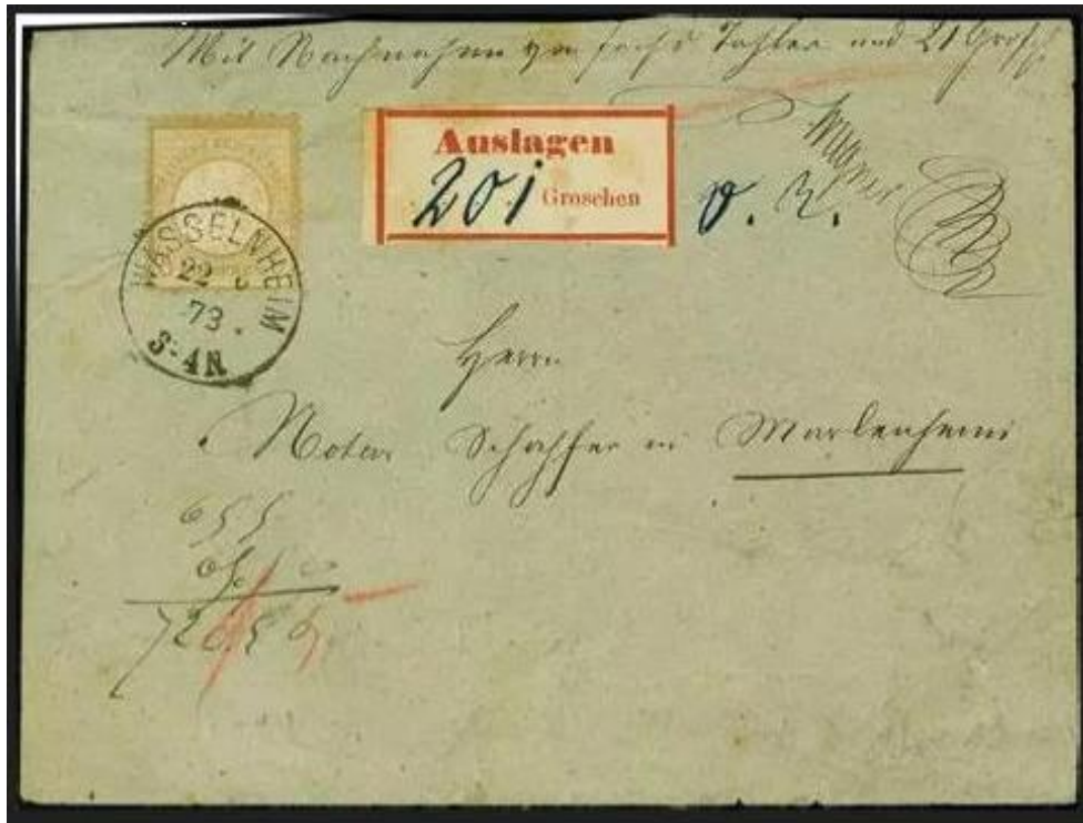
22.09.1873 : lettre de WASELONNE pour MARLENHEIM

Mention manuscrite : « Mit Nachnahme von sechs Tahler und 21 Grosch. »